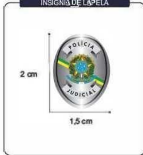
INSIGNIA DE LAPELA